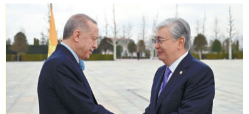
ҚАЗАҚСТАН ПРЕЗИДЕНТІ ТҮРКИЯҒА ЖҰМЫС САПАРЫМЕН БАРДЫ

Қасым-Жомарт Тоқаев 17-сәуір күні Режеп Тайып Ердоғанның шақыруымен Түркияға жұмыс сапарымен барды.